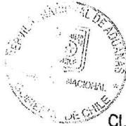
CLAUDIO SEPÚLVEDA VALENZUELA DIRECTOR NACIONAL DE ADUANAS

ANÓTESE, COMUNÍQUESE Y PUBLÍQUESE EN EL DIARIO OFICIAL Y EN LA PÁGINA WEB DEL SERVICIO.