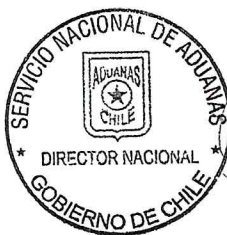
CLAUDIO SEPULVEDA VALENZUELA DIRECTOR NACIONAL DE ADUANAS (S)

ANÓTESE, COMUNÍQUESE Y PUBLÍQUESE EN EL DIARIO OFICIAL Y EN LA PÁGINA WEB DEL SERVICIO