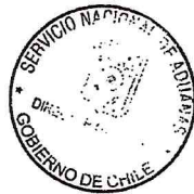
CLAUDIO SEPULVEDA VALENZUELA DIRECTOR NACIONAL DE ADUANAS (S)

ANÓTESE, COMUNÍQUESE Y PUBLÍQUESE EN EL DIARIO OFICIAL Y EN LA PÁGINA WEB DEL SERVICIO