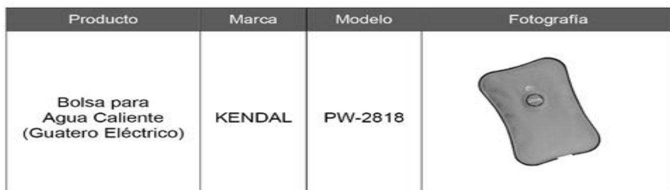
Tabla N° 1

2. En cartas de ANT. 5, la empresa Mar del Sur SpA solicitó a esta Superintendencia alzamiento de la prohibición transitoria del Oficio Circular N° 11.543, de 2013, referente a la recertificación de un lote, en la que se obtuvo un Certificado de Seguimiento, según lo indicado en la Tabla N° 2: